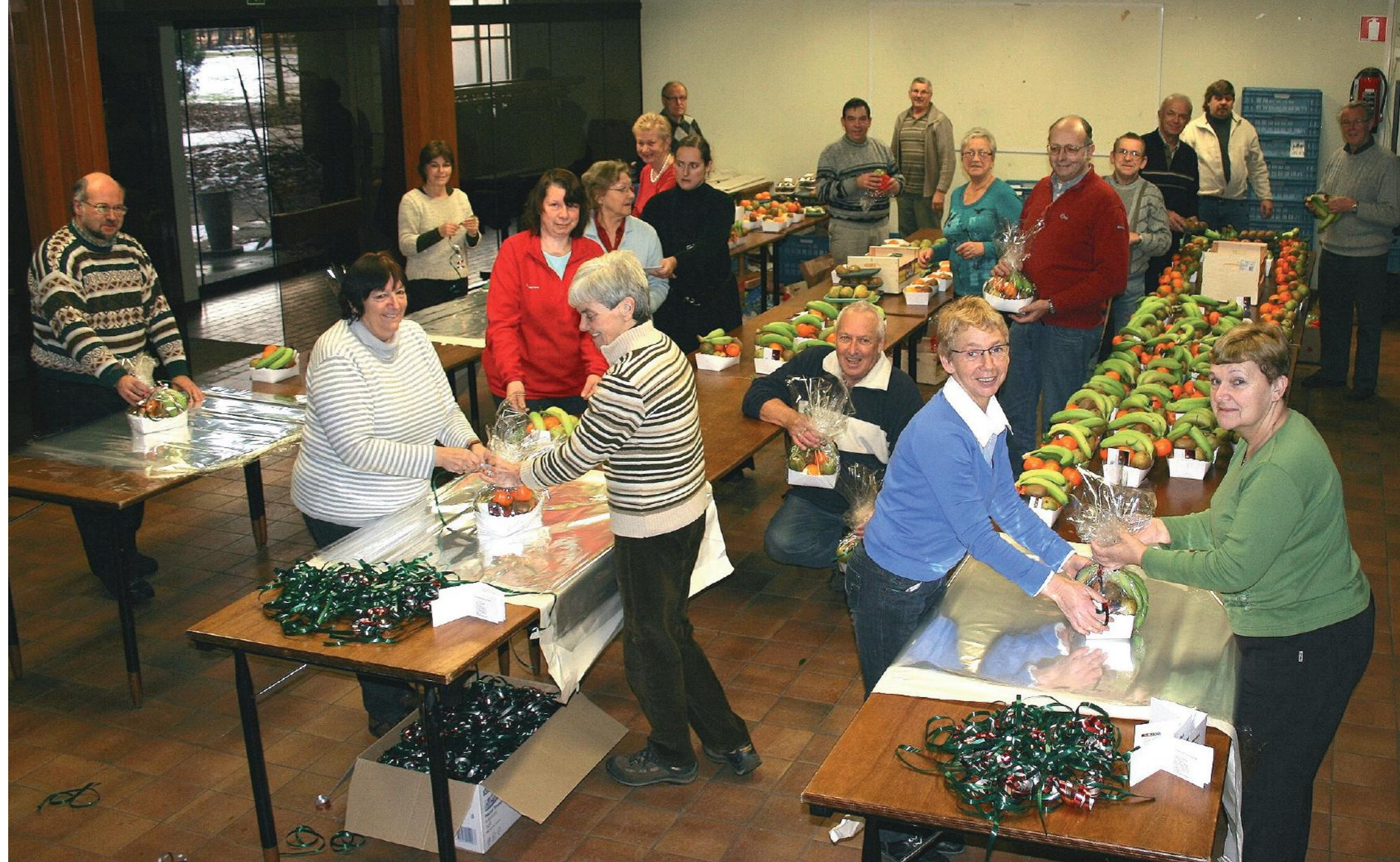
In het Koetshuis wordt zo'n 1.700 kg fruit verwerkt in meer dan 1.400 fruitmandjes.

Al meer dan veertig jaar wenst de KWB Sint-Antonius in de eindejaarsperiode alle 75-plussers van de gemeente 'zalige feestdagen' door hen aan huis een fruitmandje te gaan overhandigen. Een tiental jaren later startten de Heren van Zoersel met een gelijkaardig initiatief en nu geniet het hele project de overkoepelende steun van het gemeentebestuur. Een traditie om te koesteren!