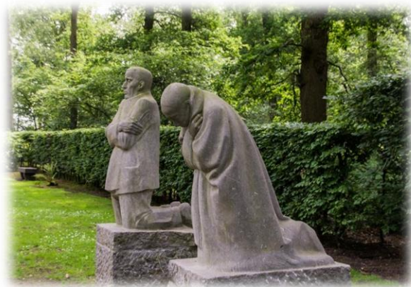
Monument Treurend Ouderpaar op het Duitse militaire kerkhof te Vladslo.

De opkomst van de crematie leidde vanaf de jaren 1930 op vele kerkhoven tot de inrichting van strooiweiden, urnenvelden en columbaria.