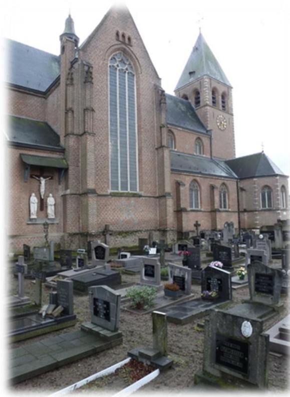
Zoersel, parochiekerk Sint-Elisabeth en kerkhof.

Met kerkhof bedoelen we de plek rond de kerk waar begraven wordt.