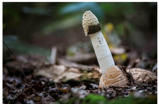
fallus impudicus of de Grote stinkzwam

Daar is de lente, daar is de zon bijna - maar ik denk dat ze weldra zal komen-, de fallus impudicus staat al in bloei en de klokken vertrekken naar Rome